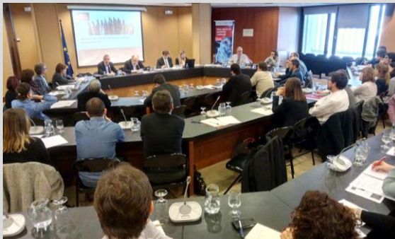
Un moment de la reunió de treball de la Taula d'indústria de l'AMB