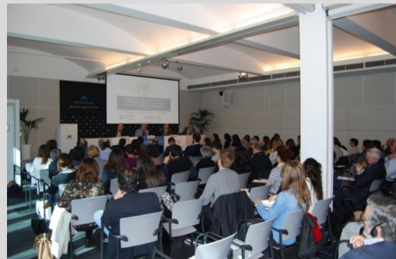
Un moment de la sessió presidida pel Pacte Industrial.