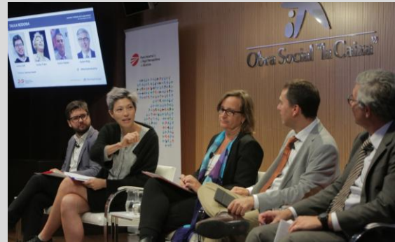
Un moment de la taula rodona