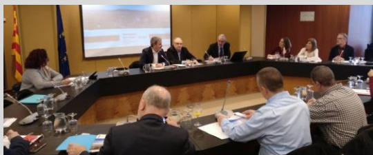
Un moment de la reunió.

El passat 19 de febrer s'ha celebrat la reunió de constitució del Consell Assessor de l'Agència Metropolitana de Desenvolupament Econòmic de l'Àrea Metropolitana de Barcelona, un òrgan que vol contribuir a consolidar una estratègia econòmica compartida per tot el territori metropolità conjuntament amb la societat civil, apostant per la col·laboració públicoprivada.