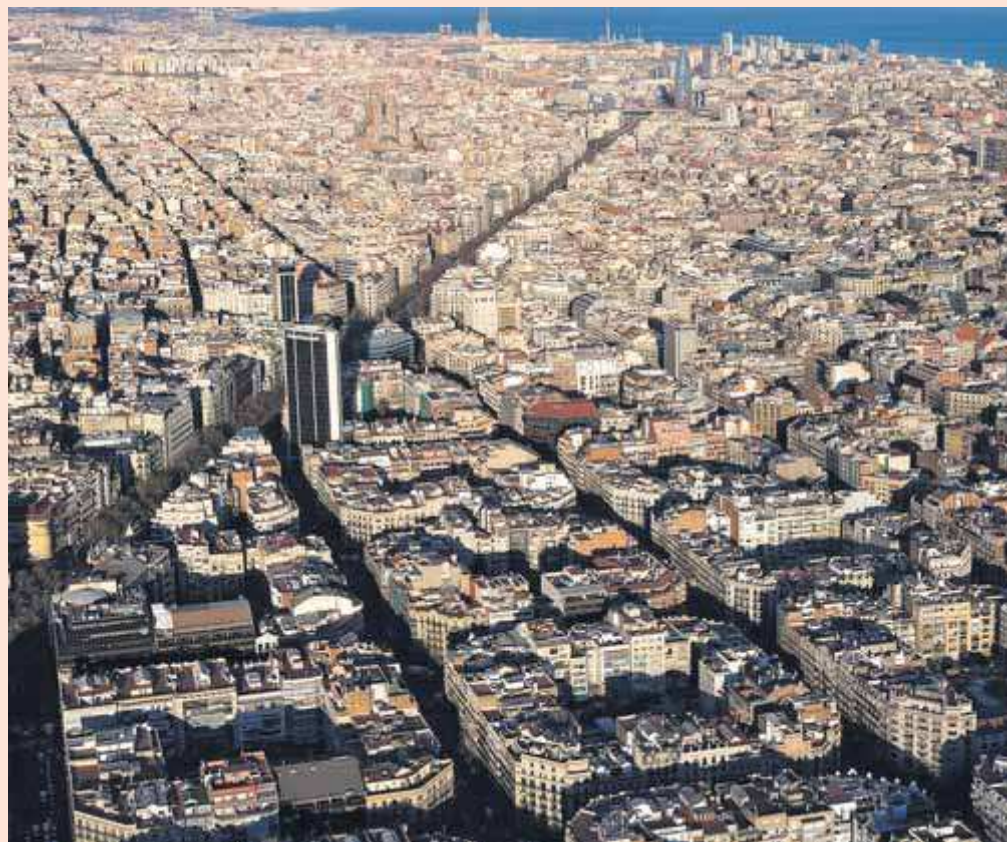
Vista aèria de l'Eixample barceloní dissenyat per l'urbanista Ildefons Cerdà.

Més escèptica, Kathrin Golda-Pongratz pensa que qualsevol dia pot irrompre un altre Sheldon Adelson i ens tornarem a enamorar. “Cada vegada hi ha més consciència ecològica però l'urbanisme continua sota la lògica de l'economia més depredadora i continuarà fins que la riquesa natural no cotitzi en borsa”.