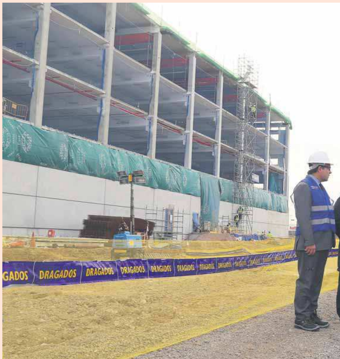
Visita d'obres del magatzem d'Amazon a Mas Blau de responsables polítics, entre els quals el president de la Generalitat.

Marina de Prat Vermell com a exemples que Barcelona encara té espais per construir-hi habitatges. Sense concretar gaire, va parlar de 30 projectes i una inversió total de 1.500 milions d'euros a deu anys vista i finançades a parts iguals per la iniciativa pública i privada. Una de les operacions més significatives serà la construcció a la Marina del Prat Vermell d'11.865 habitatges en una superfície equivalent a 40 illes de cases de l'Eixample i corredors verds que han de connectar Montjuïc amb el parc fluvial.