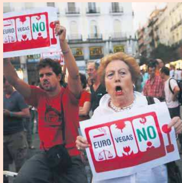
Protestes contra el projecte d'Eurovegas el 2012.

També es planteja un canvi de paradigma urbanístic en consonància amb les noves necessitats econòmiques, socials i mediambientals que su-