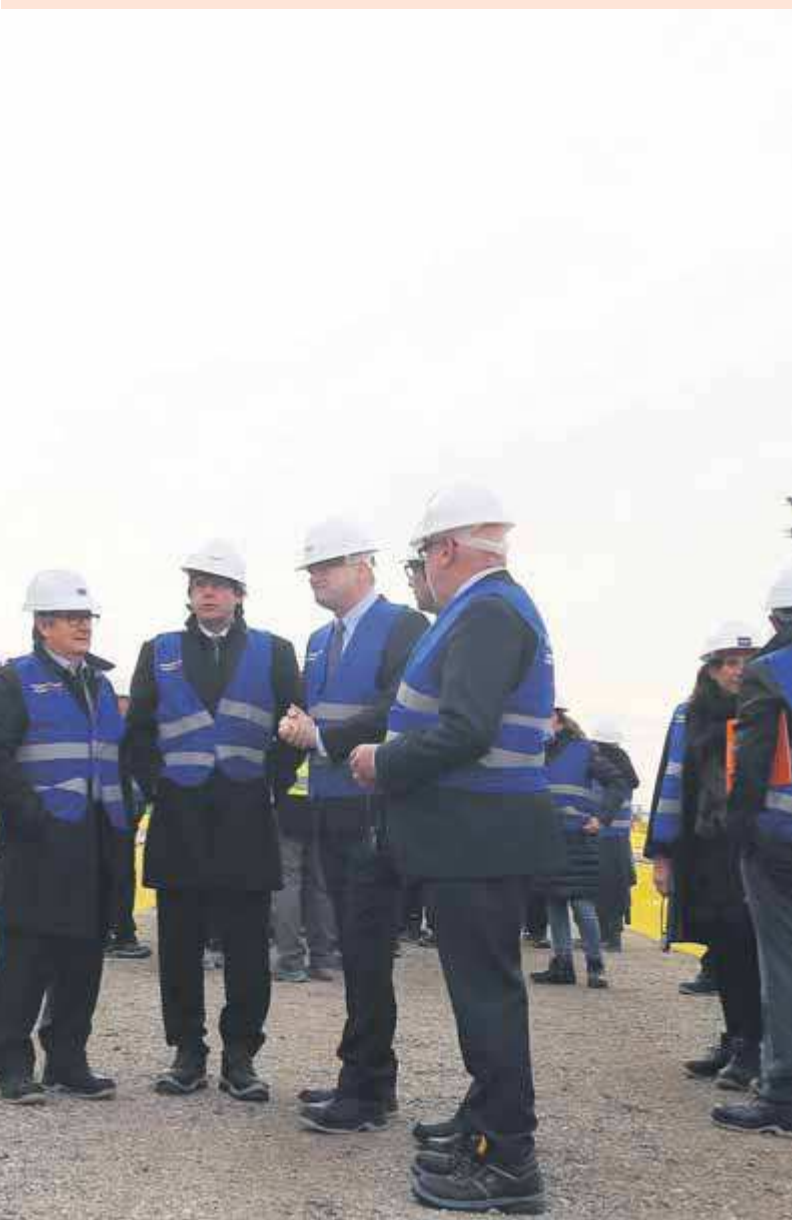
at, Carles Puigdemont, i l'alcalde del Prat, Lluís Tejedor.

envolupament econòmic i residencial al nord de la localitat en unes 164 hectàrees al costat del riu.