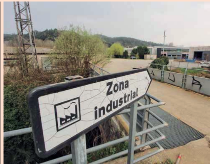
Els polígons han de cercar la cooperació amb l'emprenedoria local per millorar els serveis.

L'informe, elaborat per l'observatori econòmic Eixos, ha catalogat més de 150.000 actius comercials en més de mil polígons de tot Catalunya, posant de relleu aquest error estratègic que en molts casos