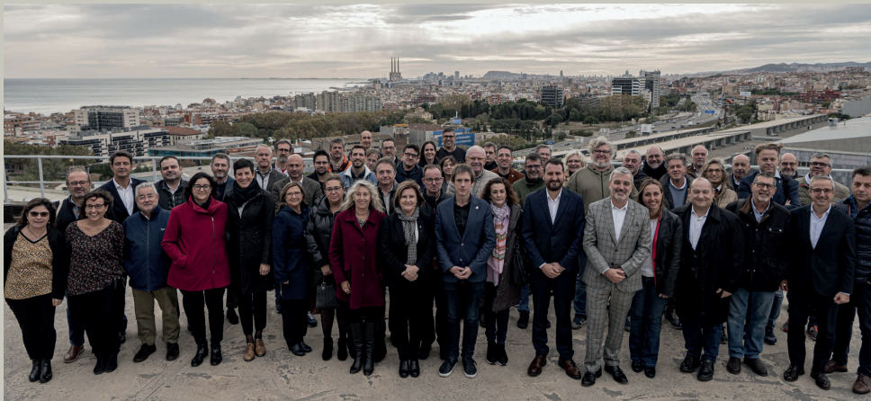
Foto de família dels assistents a la reunió.

El Pacte Industrial ha celebrat el seu XXVI Consell General i la 51a reunió del Comitè Executiu amb la participació dels representants dels ajuntaments i de les entitats que integren l'associació. Les reunions han tingut lloc el passat 22 de novembre al BCIN de Badalona. L'última vegada que la ciutat va acollir aquesta celebració va ser l'any 2008.